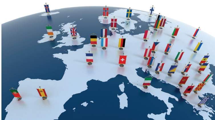
Impressum: RP Gießen, Stand: November 2015

„EU - was passiert mitten in Hessen“ Donnerstag, 3. Dezember 2015, ab 18:00 Uhr Landgrafenschloss Marburg, Fürstensaal